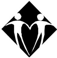
Bruger & Hjælper Gruppen